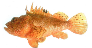
La Rascasse rouge